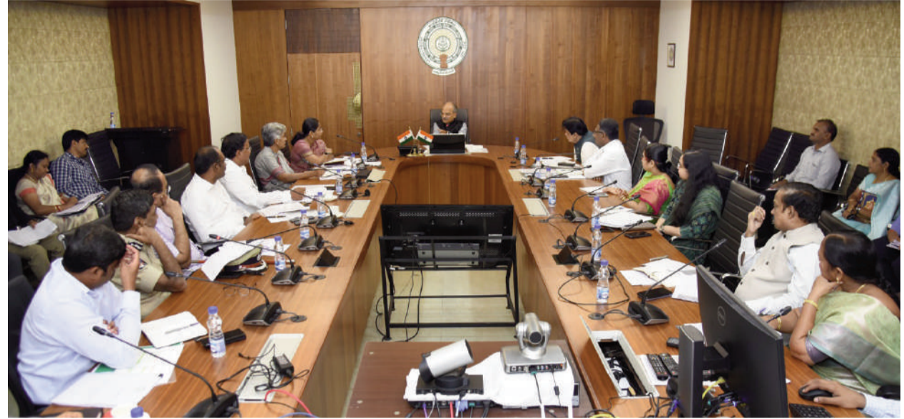
అధికారులతో సమావేశం నిర్వహిస్తున్న రాష్ట్ర ప్రభుత్వ ప్రధాన కార్యదర్శి డాక్టర్ కె.ఎస్.జవహర్ రెడ్డి

అమరావతి : రాష్ట్రంలో 18 ఏళ్ల లోపు బాల,బాలికలెవరికీ బాల్య వివాహాలు జరపకుండా కట్టు దిట్టమైన చర్యలు తీసుకోవాల్సిన అవసరం ఉందని ప్రభుత్వ ప్రధాన కార్యదర్శి డా.కె.ఎస్. జవహర్ రెడ్డి స్పష్టం చేశారు. అదే విధంగా ఎక్కడైనా బాల్య వివాహాలు జరిపినా జరిపేందుకు ప్రయత్నించినా అలాంటి కుటుంబాలకు ప్రభుత్వ ప్రధానకాలు ఏమీ వర్తించవనే అవగాహన ప్రజల్లో మరి ముఖ్యంగా తల్లిదండ్రుల్లో పెద్దఎత్తున అవగాహన కల్పించాల్సిన ఆవశ్యకత ఉందని అన్నారు. శుక్రవారం వెలగపూడిలోని రాష్ట్ర సచివాలయంలో బాల్య వివాహాల నియంత్రణకు చేపట్టనున్న ప్రచార కార్యక్రమానికి సంబంధించి ఇంటర్ డిపార్టుమెంటల్ (స్ట్రాటజీపై వివిధ శాఖల అధికారులతో సీఎస్.జవహర్ రెడ్డి సమీక్షించారు. ఈ సందర్భంగా ఆయన మాట్లాడుతూ రాష్ట్రంలో బాల్య వివాహాల నియంత్రణకు సంబంధించి ఎపి ప్రాహిబిషన్ ఆఫ్ చైల్డ్ మ్యారేజెస్ రూల్స్-2012 మరియు 2023కు సంబంధించిన నియమ నిబంధనలను కట్టుదిట్టంగా అమలు చేయాలని స్పష్టం చేశారు. ఇందుకు సంబంధించి ముఖ్యంగా మహిళా శిశు సంక్షేమం, సెర్వీ, విద్యా,వైద్య ఆరోగ్య తదితర శాఖలు సమన్వయంతో పనిచేయాలని ఆదేశించారు. ఈ సూతన నిబంధనల ప్రకారం వివిధ స్థాయిల్లో చైల్డ్ మ్యారేజెస్ ప్రాహిబిషన్ అధికారులను