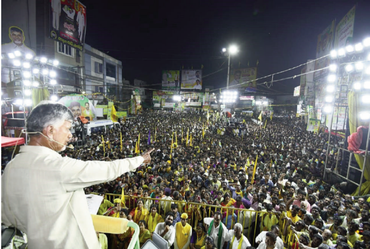
భవిష్యత్ కు గ్యారంటీ కార్యక్రమంలో భాగంగా అమలాపురంలో డీడీపీ జాతీయ అధ్యక్షుడు, మాజీ ముఖ్యమంత్రి నారా చంద్రబాబు నాయుడు శుక్రవారం రోడ్ షో నిర్వహించారు. ఈ సందర్భంగా మాట్లాడుతూ సీఎం జగన్ రాష్ట్రాన్ని నిలుపునా దోపిడీ చేస్తున్నాడని ధ్వజమెత్తారు. రోడ్ షోలో ఆయన ఏం మాట్లాడారంటే..